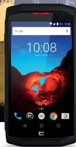
PACK PRO TREKKER-X3 + REPRISE SMARTPHONE 80€ TTC remboursés*

RÉSERVÉE AUX CLIENTS DES ENSEIGNES DE FOURNITURES POUR LE BÂTIMENT & L'AGRICULTURE